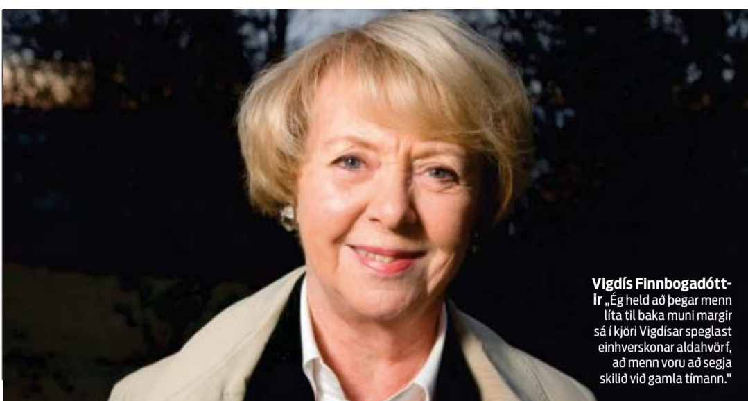
Vigdís Finnbogadóttir „Ég held að þegar menn líta til baka muni margir sjá í kjöri Vigdísar speglast einhverskonar aldhvörf, að menn voru að segja skilið við gamla tímann.“

Svo að ég ákvað að birta grein til stuðnings Ólafi Ragnari í viðlesnu blaði nokkrum dögum fyrir kosningar. Þar minnti ég á að hann væri „einn af oss“ og hét pistillinn „Strákur að vestan“. (Hvað annað?!) Og ég veit að sú grein þótti ekki spilla fyrir, enda gáfu stuðningsmenn hans út bók um kosningabaráttuna og sigurinn árið eftir, og endaði hún á þessari tilvitnun; strákur að vestan. ■